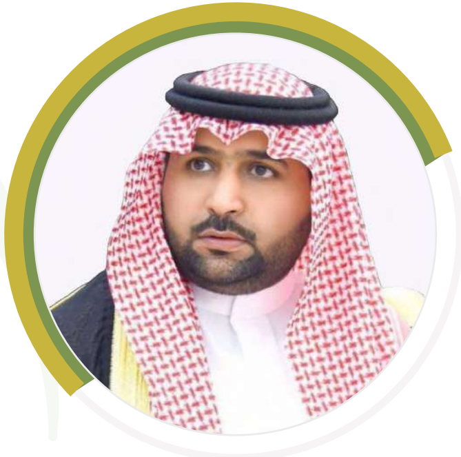
صاحب السمو الملكي الأمير محمد بن عبدالعزيز بن محمد بن عبدالعزيز نائب أمير منطقة جازان