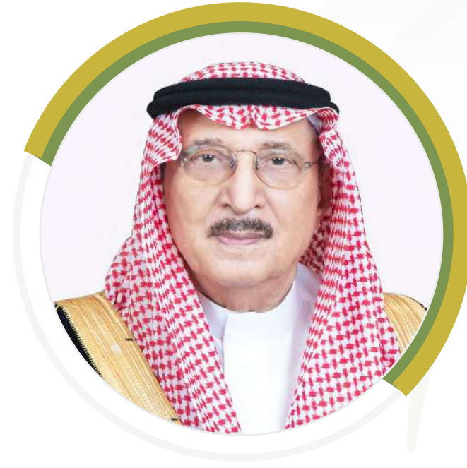
صاحب السمو الملكي الأمير محمد بن ناصر بن عبدالعزيز أمير منطقة جازان